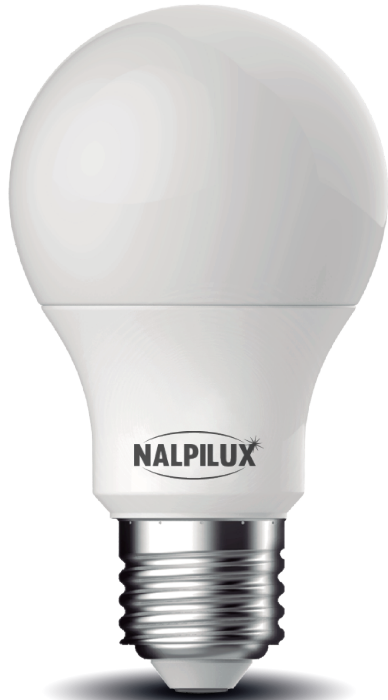
La imagen es ilustrativa el producto puede variar

Bombilla LED en forma de bulb, perfecta para iluminar espacios domésticos y proporcionar iluminación de calidad certificada.