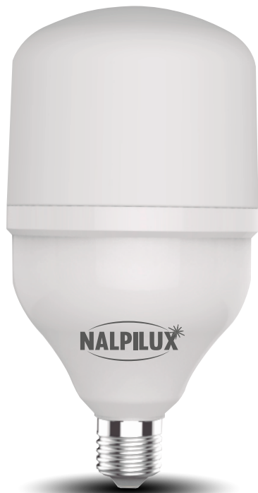
La imagen es ilustrativa el producto puede variar

Bombilla y/o Lámpara LED en forma de bulb, perfecta para iluminar espacios domésticos y proporcionar iluminación de calidad certificada.